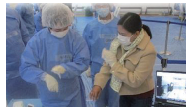
▲ 原子力災害医療活動訓練（避難退域時検査）