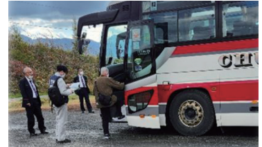
▲ 住民避難等訓練（バスによる避難）

また、大型バス、自衛隊車両などが多数訓練走行しますので、あらかじめご了承くださいとともに、ご協力をよろしくお願いします。