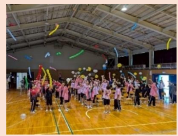
▲風船飛ばしの様子