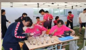
▲一年次のチョコバナナ

一年生は初めての余紅祭、二年生は初めての中庭での余紅祭で心躍るものがありましたが、一般公開で来てくれる方への感謝を忘れずに余紅祭を全力で楽しんでいたいと思います。PTAの方々が作ってくださったカレーライスはお若男女問わず大人気で、みんな美味しそうに食べる姿が見受けられました。今年は、このとても暑い夏のためにと、クーラーボックスで冷えた飲み物も販売してくれていました。余紅祭の最後に行われる抽選会では、豪華な景品がたくさん並んでいて非常に盛り上がっていたのが印象に残っています。その後は名残惜しそうに生徒たちは後片付けをして、余紅祭を締めくくりました。足を運んでくださった方々、お手伝いをしてくださった方々には感謝いたします。皆さんの協力のおかげで、高校生活での大切な思い出を作ることができました。