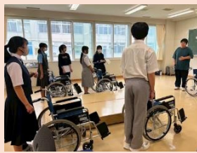
▲福祉の体験の様子