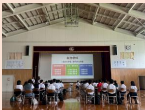
▲学校説明をしている様子

短い時間ではありましたが紅志への魅力が伝わっていたら、興味・関心を持っていただけたら嬉しいです。