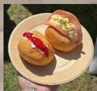
▲二の年次のサンドイッチ