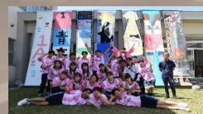
▲三年次の集合写真