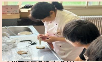
▲出前講座の様子(食品)