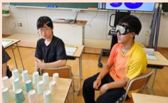
▲出前講座の様子(福祉)

一年生はまだ将来の自分について具体的に考えることが少なかったと思いますが、今回で将来の自分をイメージできたと思います。二年生は来年に向けて方向性をより固めることができました。