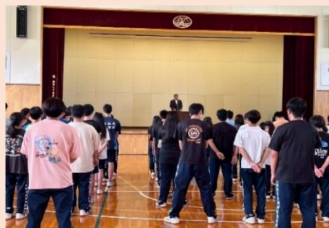
▲夏期休業明け全校集会

新しい季節、新しい挑戦。一日一日を大切に、充実した毎日をみんなで作っていきましょう！