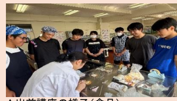
▲出前講座の様子(食品)