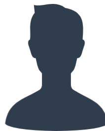
現役隊員の声その2

私たちが日常的にサポートしてくれる役場職員の皆さんは、こちらの問い合わせで分からない時があっても、すぐに調べて回答いただくので、 私たちが活動しやすいよう努力してくれていると感じます！