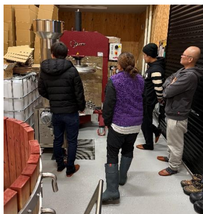
[農楽蔵 (左) / torocco winery (右) / ド・モンテューユ&北海道の視察 (右上) ]